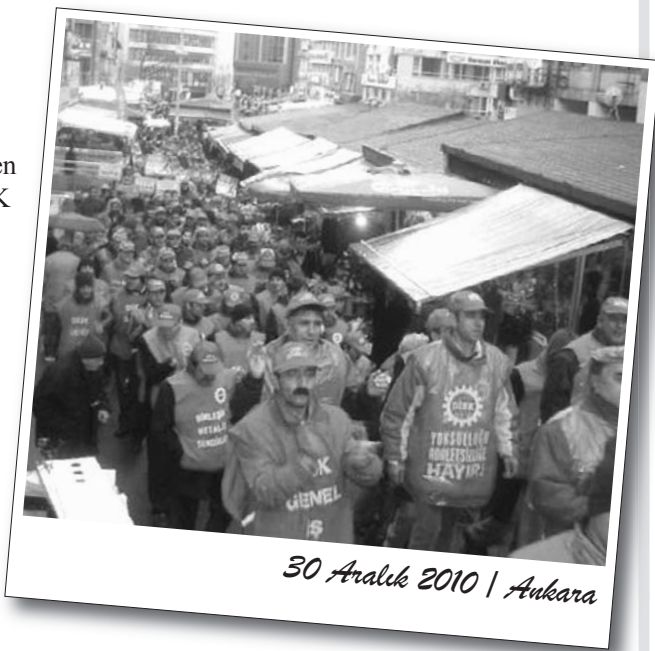
30 Aralık 2010 | Ankara

DİSK üyeleri Sakarya, Yüksel Caddesi güzergahından yürüyerek Akay Kavşağı'na ulaştıklarında bir kez daha polis barikatıyla karşılaştılar. Polisin, DİSK'lilerin TBMM önüne gitmelerine izin vermemesi üzerine temsilci heyet TBMM'ye gönderildi. DİSK'in hazırladığı dosya TBMM Plan ve Bütçe Komisyonu'nun CHP'li üyelerine verildi.